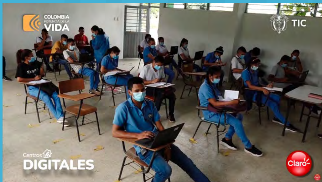
San Matías, Antioquia