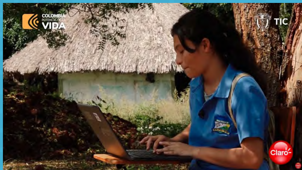
San Juan del César, La Guajira